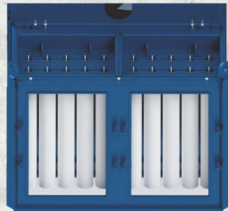
Polyester Filterschläuche (M PTFE) 2 Kammer je mit 15 Filtereinheiten