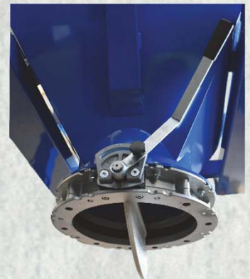
Butterfly-Ventil d. 400